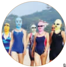
◀青岛大妈头戴“脸基尼”走在海滩上

当大妈们遇见美容和时尚，迸发出的创意真是让人万万想不到！除了“脸基尼”，还有风情无限的钢管舞、生猛的黄瓜面膜……记者地毯式搜罗南京大妈的美容时尚创意，给这些机智可爱的“资深美女”们点个赞。 现代快报记者 王苏颖 昂洁 马晶晶