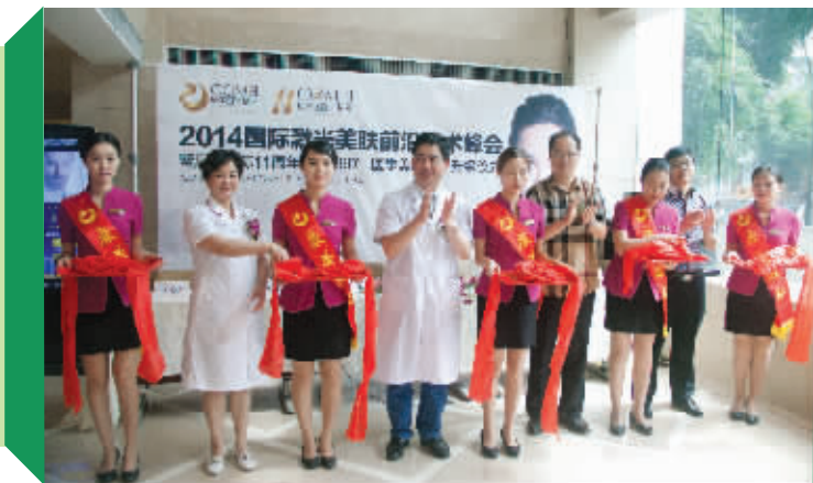
康美国际360°医学美肤中心V2.0升级剪彩仪式

康美国际十一年塑美之路,足迹遍及全球。2014国际激光美肤前沿技术峰会,暨康美国际11周年院庆、360°医学美肤中心升级活动,于8月16日上午9时许,在康美国际拉开帷幕。本次活动吸引了来自全球各地的顶级皮肤专家,国内多家媒体,以及上千名求美者前来关注。 文/张弛