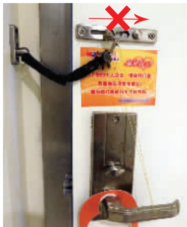
按“皮筋开锁法”,未能打开链条锁

对于酒店防盗锁的问题,南京市公安局治安巡逻管理警察支队(公安治安分局)的安警官指出,市民不用过于担心,因为如今所有酒店都安装了监控设备,窃贼一旦作案,很容易被逮到。不过,防范措施还是必要的,比如在房门后放个椅子,一旦有不法分子企图进入,可以提前有所防范。