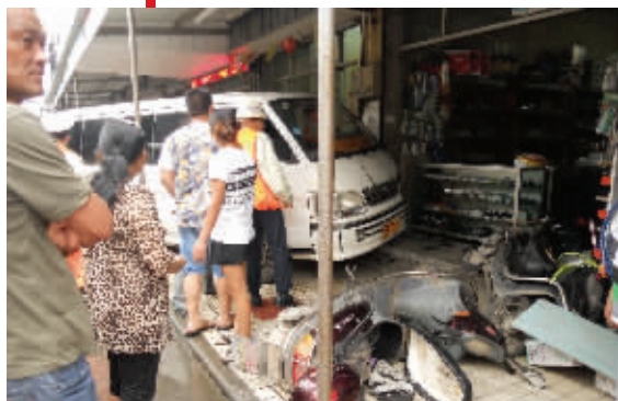
事发现场

常熟一名7岁的“熊孩子”趁人不备,偷偷发动了停在路边的一辆面包车,将车开出了20多米,引发连环撞击后,又冲进一家五金店,险酿大祸。