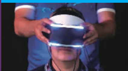
索尼的VR头盔梦神,淡蓝色的光酷极了

相对于较小的动漫游戏展会来说,科隆游戏展给人一种“高大上”的感觉,参展的公司都是国际知名的大佬,这些公司为了获得玩家的青睐不惜财力,在展区布置和设备上都是毫不吝啬。2013年的展会就有34万人到场,现在的科隆游戏展是很多人心中