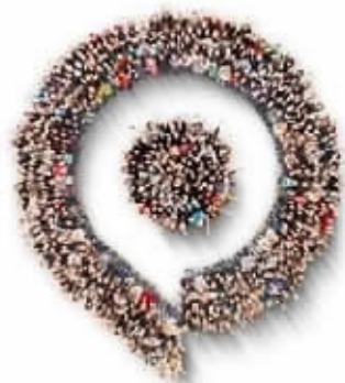
2014科隆游戏展中EA的研讨会

索尼、微软、KONAMI、THO等等,这些代表着业界最高水准的公司把所有能拿得出手的新游戏和设备全都放到了科隆,玩家们可以在科隆游戏展上把世界上所有重要的游戏信息尽收眼底。除了拼人气和爆料,游戏公司们相互之间也会较劲比拼各自的作品,科隆游戏展专门为这些游戏设立很多奖项,今年科隆游戏展的奖项方面,最佳游戏是THO的《进化》,同时《进化》总共晋级13个奖项。玩家们可以在科隆能获得网上和地区无法获得的体验与感受,这就是为什么科隆游戏展办成一个世界级别的游戏展,又能做到成为最盛大的展会的原因。