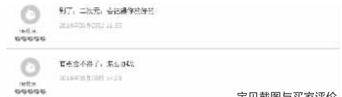
宝贝截图与买家评价

“早起的叫醒电话,睡前晚安,聆听课业抱怨与工作烦恼,给予鼓励,每天不少于15条短信,可根据要求设定女友性格,萝莉、御姐、无口、病娇、邻家由你选择。”卖家在宝贝详情里,详细列出这个触不到的女朋友所提供的各项服务。这些服务都是远程的,服务方式是短信、微信、网络。至于服务收费,一天20元,三天50元,六天90元。