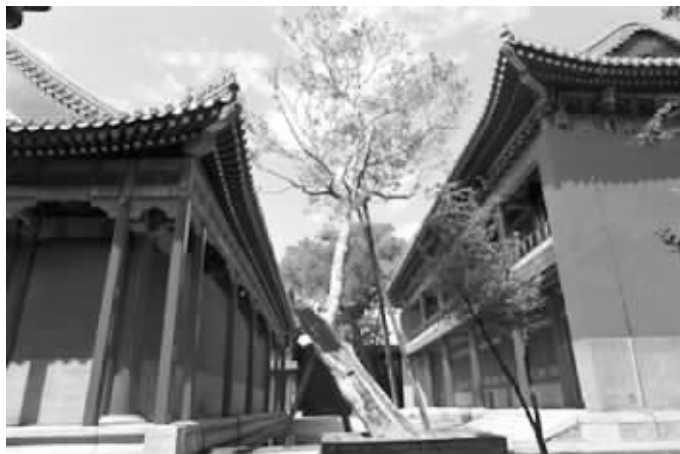
8月15日,尚未开放的故宫慈宁花园修缮工程已经完成

未来,故宫将力争达到80%-90%的面积对外开放,让游客有更多参观选择的同时,缓解现有开放区域的接待压力。