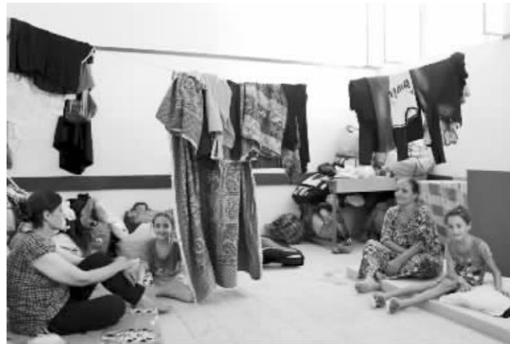
逃亡的民众不得不住在教堂里