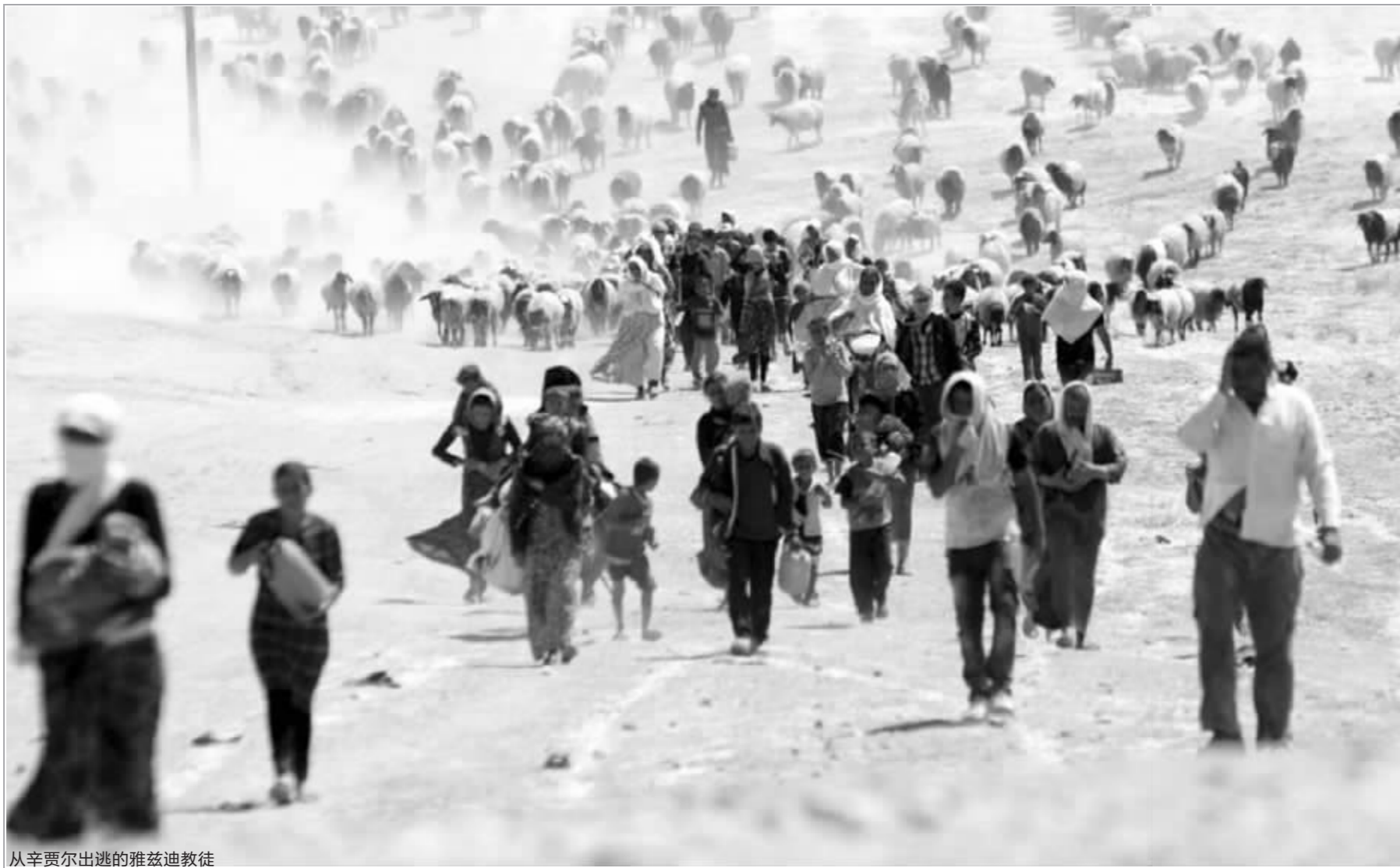
从辛贾尔出逃的雅兹迪教徒