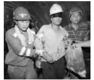
8月16日，一名被困工人在救援人员的搀扶下走出营救巷道

16日14时10分，贵州省“8·10”隧道坍塌13名被困人员成功获救。经初步检查，被困人员身体状况良好。