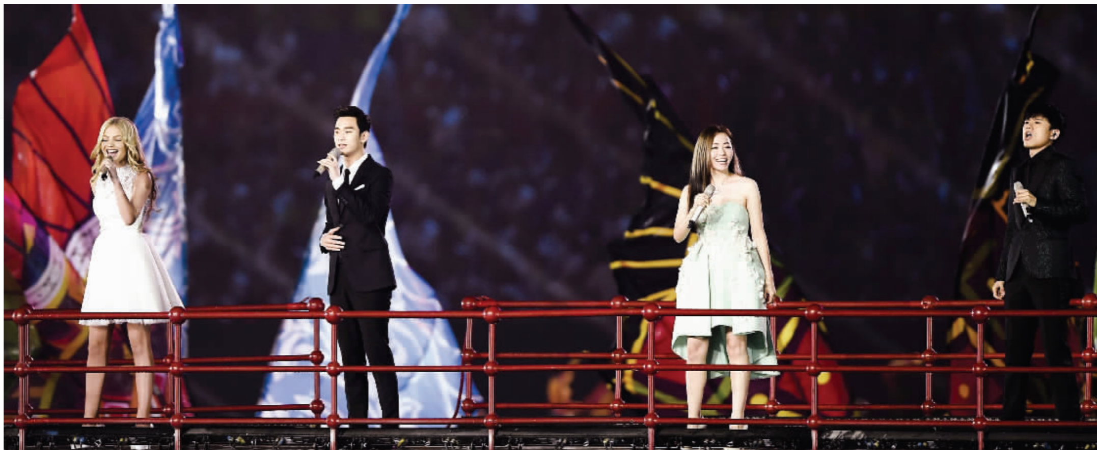
青年歌手张靓颖、张杰，与韩国人气明星金秀贤、俄罗斯歌手噶丽娅共同唱响开幕式主题歌《点亮未来》