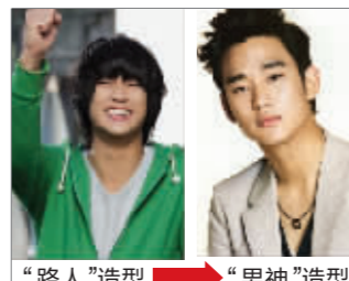
“路人”造型 → “男神”造型

和酒店沟通过餐饮等事项，并且规定酒店员工不准和金秀贤合影。到南京了，很多粉丝都关心自己的偶像有没有品尝南京美食。酒店工作人员介绍，尽