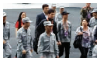
金秀贤出行,保安层层护驾