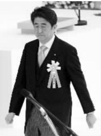
安倍个人出资献祭