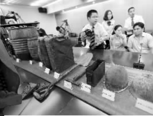
飞虎队用过的物品