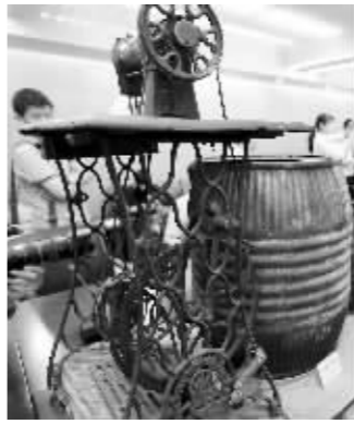
美军使用过的缝纫机

世界友人及盟军也积极支持了中国人民的抗日战争。此次纪念馆获赠的34件抗战文物主要反映了中国远征军滇缅作战以及中国空军美籍志愿大队（飞虎队）开辟“驼峰航线”援华作战的历史。