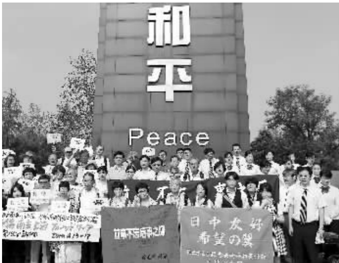
中日和平友好人士在和平广场合影