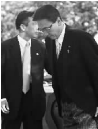
日本内阁大臣参拜靖国神社