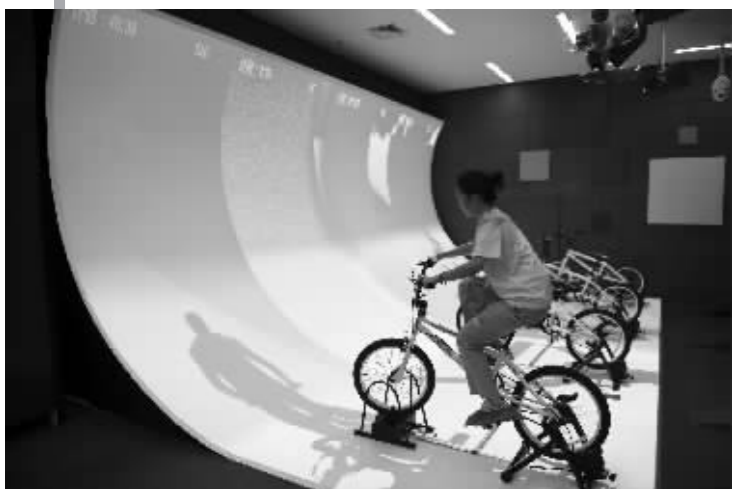
志愿者在演示骑行运动体验设施