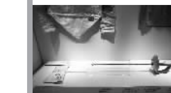
博物馆陈列的丰满的体育物品