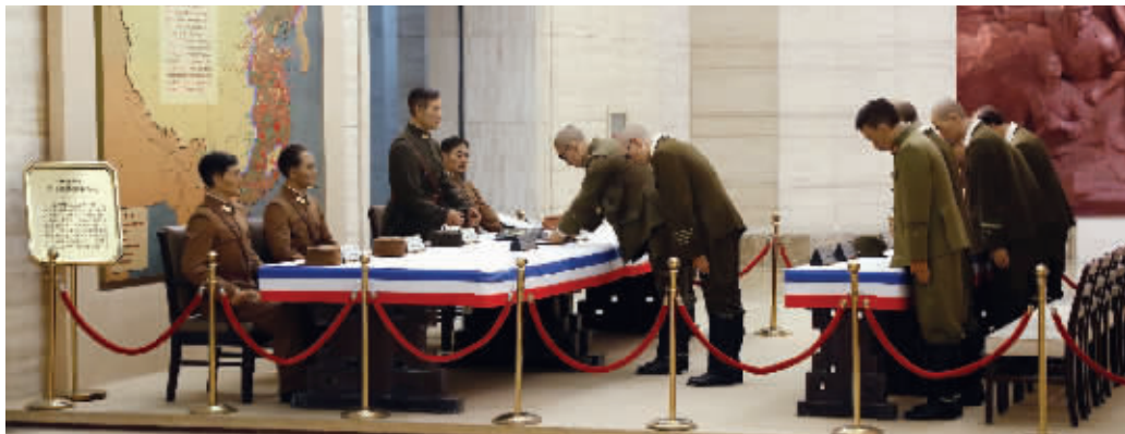
侵华日军投降签字仪式旧址内的雕塑, 如实还原了69年前的场景