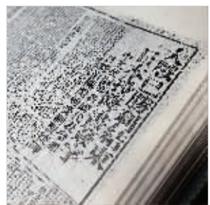
当时国内各大报纸头条庆祝