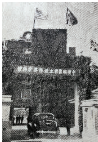
当年专门挂起横幅庆祝

据介绍, 侵华日军投降签字仪式旧址里, 当年日军签字投降的大厅, 以前常会有抗战老兵们回去看看。