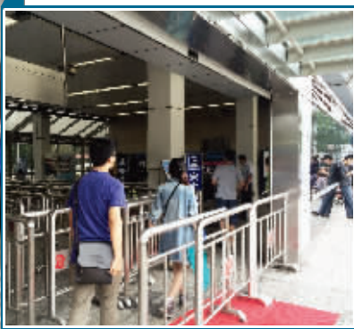
这条直达通道高峰期成为绿色通道