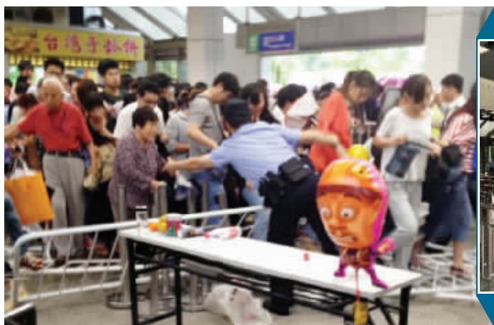
护栏被挤倒 请供图网友来领稿费