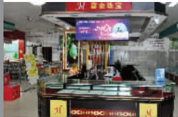
价值百万的黄金被偷走