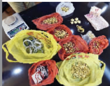
警方目前已追回约3公斤赃物