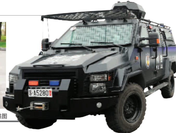
警方为青奥安保使用的部分高科技设备,主要有4G图像传输设备、EOD-9排爆服、装甲突击车等