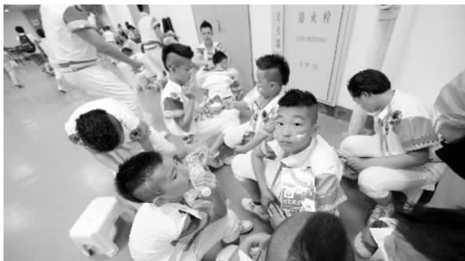
小演员们在做彩排前准备