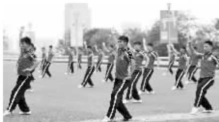
演员们在彩排前训练