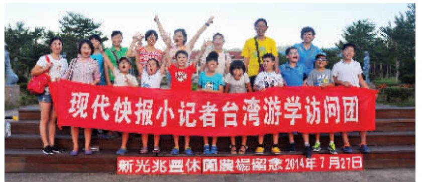
现代快报小记者兆丰农场合影