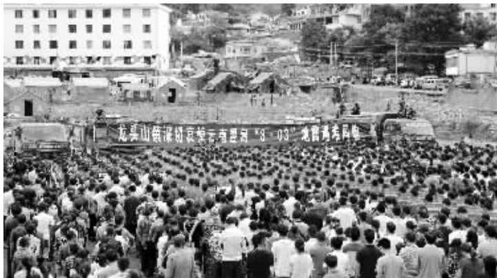
救援队伍和受灾群众在震中龙头山镇悼念遇难同胞

笛声呜咽,警报哀鸣。10日10时,沉痛哀悼云南鲁甸“8·03”6.5级地震遇难同胞仪式在鲁甸县城举行。同一时间,从震中龙头山到省城昆明,从梅里雪山到珠江源头,从乌蒙山区到孔雀之乡,云南各地各族群众就地默哀3分钟,深切缅怀地震遇难同胞。