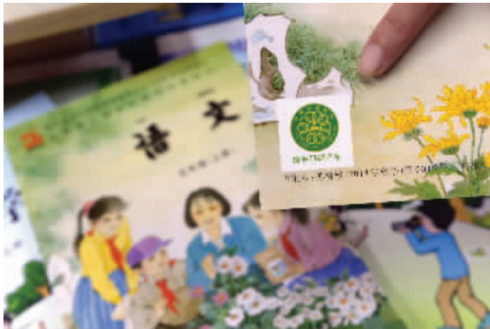
新课本封底印有“绿色印刷产品”标志