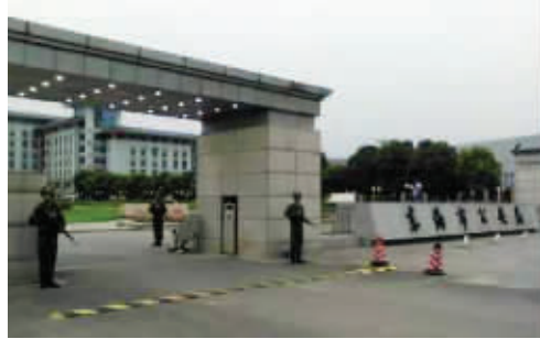
《特警力量》剧组在南农校门口拍摄(图片拍摄者来领稿费)