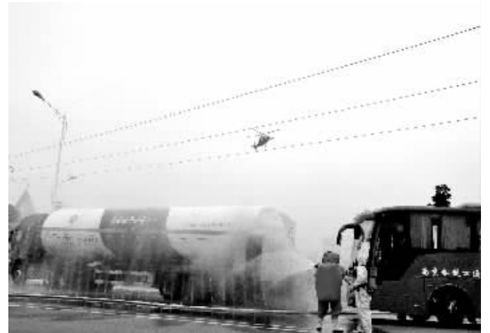
综合演练中,直升机也出动了

这次演练是为磨合多部门协调作战机制,提高快速反应能力和应急处置能力,根据青奥会安保训练工作总体部署要求开展的。演练由南京警方牵头南京市安监、交通运输、质监、环保、卫生、化工园管委会、供电、港华燃气等单位联合参与。