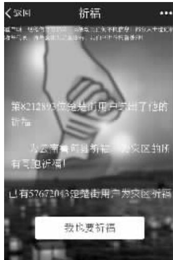
昨晚9点57分,楚楚街祈福页面截图

不过,腾讯方面也指出,由于这些链接确实存在诱导用户分享的行为,违反了微信公众平台运营规则,目前腾讯已对其进行了相应处理。