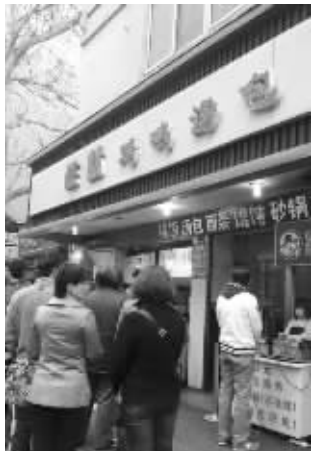
位于明瓦廊的旺点鸡鸣汤包

“企业在做发展规划和品牌规划的时候,要综合考虑到商标的注册问题,因为商标是品牌的核心。”江苏省工商局商标处处长冯兴汉说,特别是对一些老字号品牌的商标保护,企业应该考虑到行业特点,多选择几个类别,完善地保护自己的品牌商标。