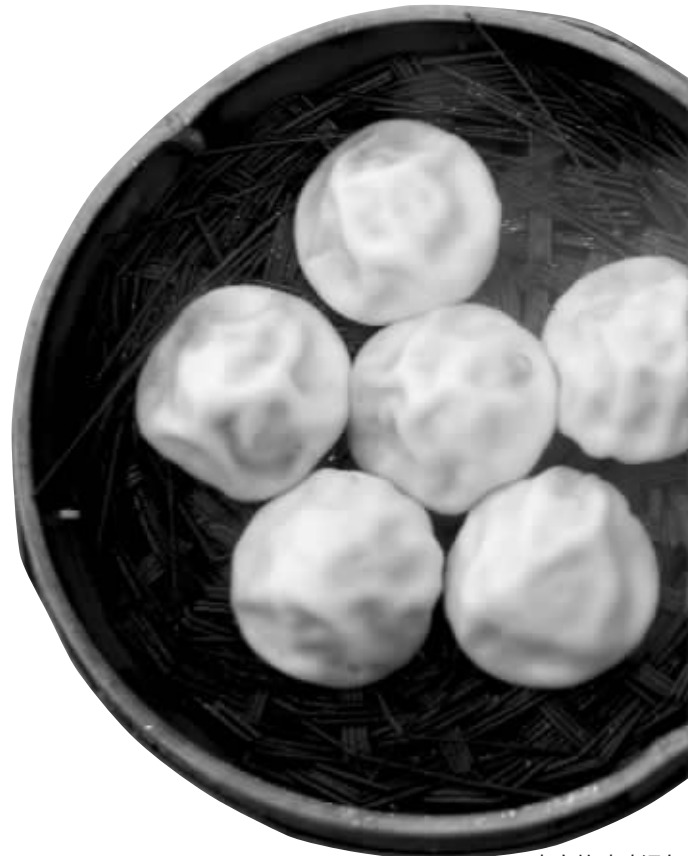
南京的鸡鸣汤包

鸡鸣汤包PK鸡鸣八宝粥,两地名小吃引发商标之争 专家:应该不构成侵权,但建议老字号加强商标保护