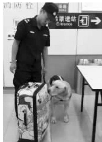
警犬进轨交站区，安检更有保障