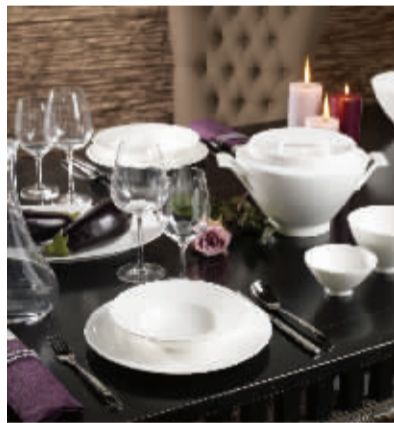
德国唯宝 新经典 La Classica Nouva系列