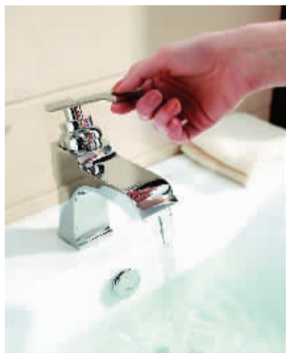
新国标对多种元素的析出量有强制规定