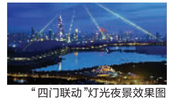
“四门联动”灯光夜景效果图

西干长巷一线完整的城墙尽收眼底,这里的城墙轮廓线最美。玄武湖:玄武湖樱洲附近是观赏“四门联动”激光表演的最佳处,抬头看闪烁的光束照亮夜空。