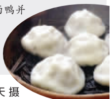
菊花脑汤包 现代快报记者 夏天 摄