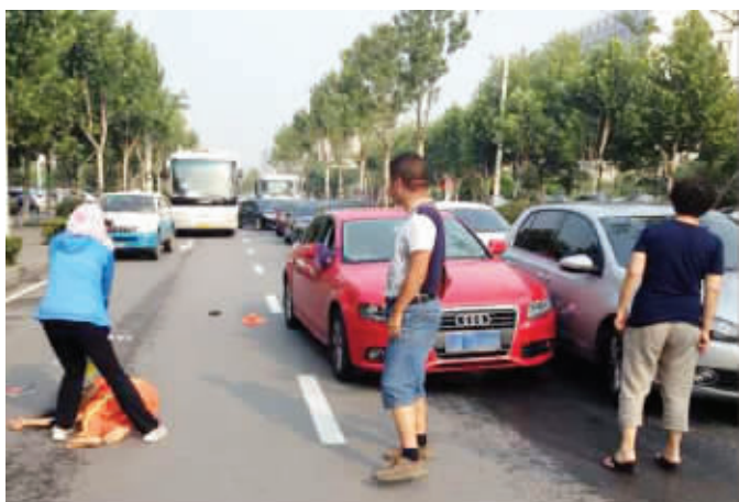
事故现场,环卫工被红色奥迪车撞倒 报料人供图