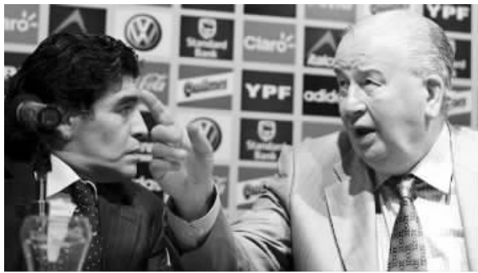
格隆多纳(右)和马拉多纳