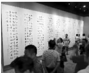
展览现场人气很高