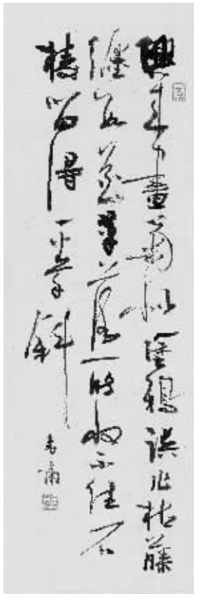
以上为李啸书法作品