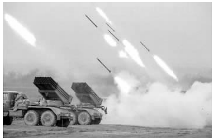
俄罗斯“冰雹”多管火箭炮

奥巴马目前仅与伊拉克通过4次电话,拜登有60多次。一部分原因可能在于拜登通常要和伊拉克三个不同派别的领导人:什叶派的总理马利基、逊尼派的国会议长贾布里,还有库尔德自治区政府领导人巴尔扎尼分别通话。