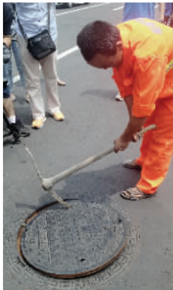
燕山路窨井盖换成了防沉降式

窨井盖是城市地下管网的窗口,但时间长了,会出现劈裂、缺失现象,成了道路上的“肚脐眼”。据了解,在迎青奥的市政设施整治中,市政部门还对大桥南路、龙蟠路、龙蟠中路、中山北路、中山南路等133条道路上3366个井盖进行了集中整治,大部分更换成了防沉降的井盖。