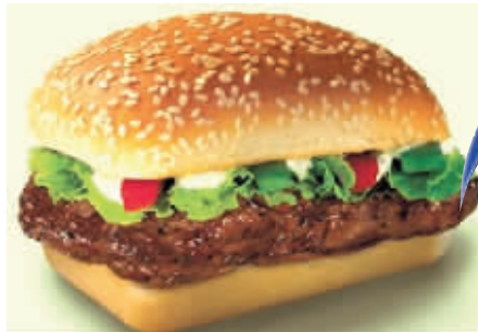
香艳汉堡 变身肉夹馍