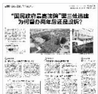
昨日快报相关报道

上的违建问题,还需要相关的建设单位进行处理。“我们希望能够将违建赶快拆除,恢复对文物建筑的保护。”