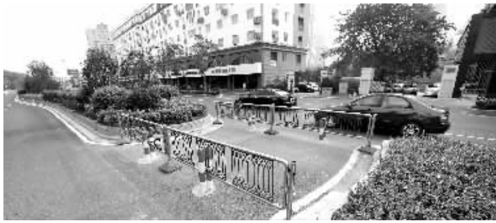
城西干道多处掉头路段被封住