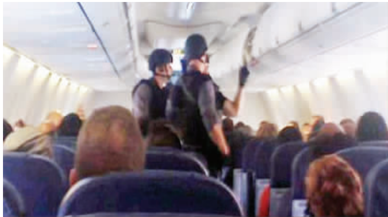
加拿大特警冲上飞机逮捕肇事者