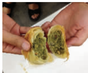
芦蒿月饼的馅是绿色的