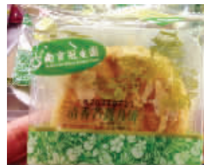
商家推出新品——芦蒿月饼

其实,芦蒿月饼就是通过机器把新鲜的芦蒿碾成粉,做成月饼馅。除了芦蒿粉,里面还有核桃仁、松子仁、芸豆、杏仁、西瓜籽仁等,“所以口味上比较接近五仁月饼,但又比五仁月饼多了一股芦蒿的清香味。”