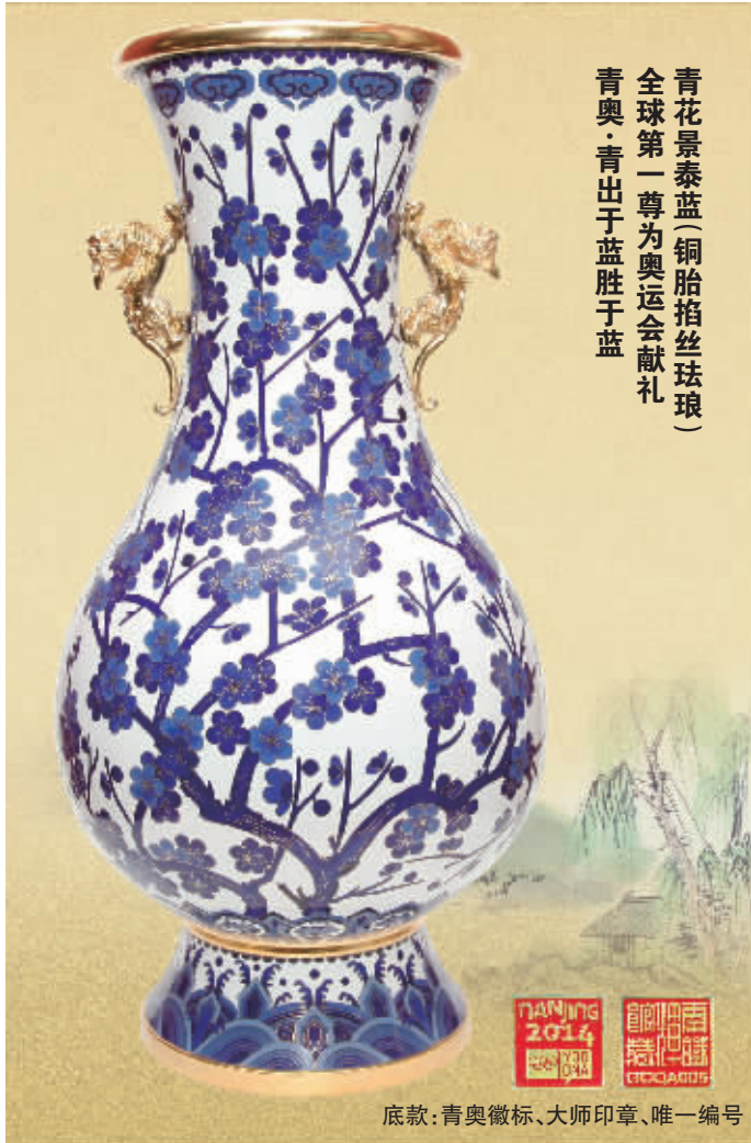
青花景泰蓝(铜胎掐丝珐琅) 全球第一尊为奥运会献礼 青奥·青出于蓝胜于蓝

霍铁辉, 中国工艺美术大师、景泰蓝技艺的代表性传承人。从艺 50 余年, 其作品多被博物馆和佛教圣地珍藏, 价值高达数千万。2014 第二届青奥会在南京举办, 这是继 2008 北京奥运会, 中国第二次举办的奥运盛会, 这代表着祖国发展的蓬勃之势, 霍铁辉大师在 70 岁古稀之年欣然创作《青傲瓶》, 祝福 2014 青奥会圆满成功。