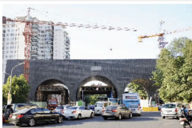
太平门的施工围挡基本拆除