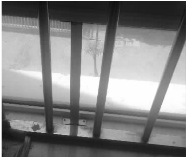
物业说飘窗和阳台安装支架后,下坠变形问题就能解决