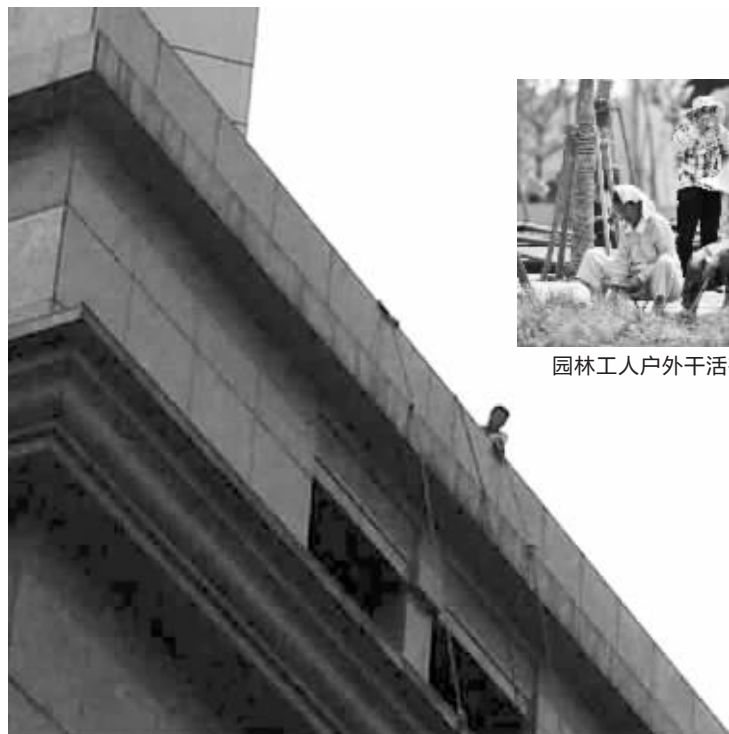
“蜘蛛人”正准备清洗玻璃