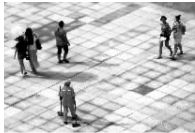
烈日下,环卫工在广场上来回清扫

昨天,南京的最高气温将近36℃,大多数人都尽量减少出门时间。然而,由于工作原因,仍有一些人必须长时间待在室外劳作,有的甚至“上天入地”,忍受常人难以想象的煎熬。