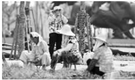
园林工人户外干活有三宝:毛巾、凉水和草帽