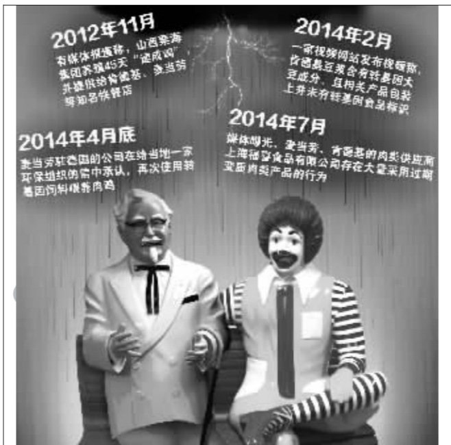
麦当劳、肯德基再陷食品安全危机