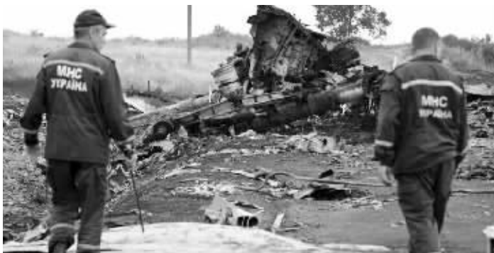
惨烈的事故现场

到过失事现场的武装分子告诉斯特莱尔科夫,“很多尸体的血已流干,开始腐臭”,还在残骸中发现了大量的血清和药物。随后斯特莱尔科夫断定,残骸附近的遇难者在飞机起飞前就“死了好几天”。他还将矛头指向乌克兰政府,称乌政