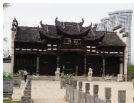
和园坐落在高楼间

位于和园附近的鱼嘴湿地公园即将完工。和园所在的南京国际青年文化广场东起油坊桥、西至长江夹江,约2.5公里,地下负三层为过江隧道连接段,可直接进入青奥村和南京国际青年文化中心,地上则是以奥运、青春、体育、国际文化为特色的城市轴线。值得一提的是,青奥体育雕塑“九骏”、