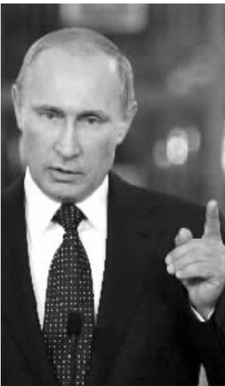
7月16日,在巴西首都巴西利亚,俄罗斯总统普京对记者讲话