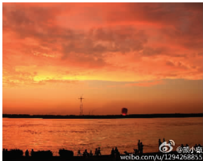
网友摄于南京燕子矶江边