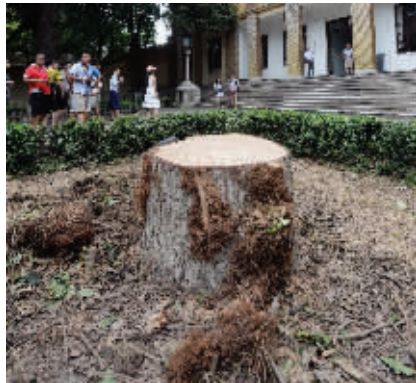
雪松只剩树根