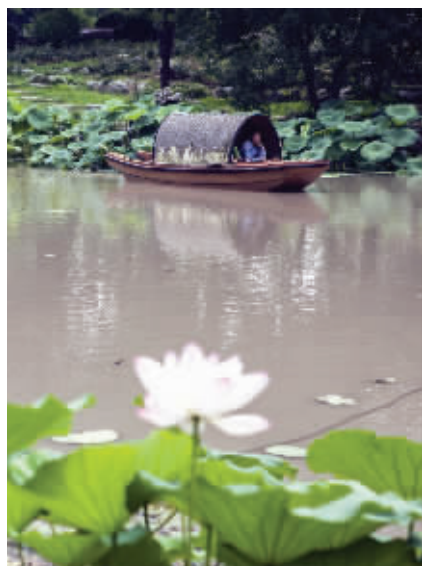
内湖湖水浑浊发黄

浑浊的湖水集中在樱洲的东南方向,主要有两个原因。“一个是附近正在整修驳岸,所以黄土流进湖内比较多。第二个是因为防汛,玄武湖水位人为降低了,内湖里的电动乌篷船行驶时,船浆会把下面的淤泥翻上来。”这位工作人员表示,再过几天,黄土沉降,湖水又会变干净了。