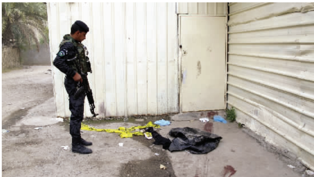
7月13日,在伊拉克首都巴格达,一名警察查看枪击现场

12日晚间,不明身份枪手突袭巴格达东城扎尤纳区两栋建筑,开枪打死至少25名女性。 据新华社