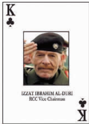
扑克牌通缉令中的杜里

杜里曾患有白血病,身体状况不佳,还一度传出他已经身亡的消息。但外界认为,杜里目前领导着一支名为“纳克什班迪教团军”的逊尼派武装组织,并支持ISIS在上月攻占伊拉克北部和西部大片地区。