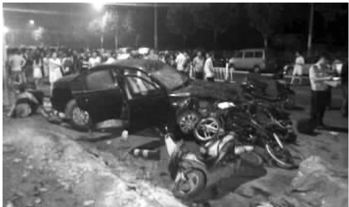
从这一片狼藉,能想象出车祸有多惨