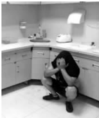
肇事司机蹲在地上,懊悔不已