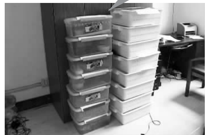
这15个箱子装了15条蟒蛇