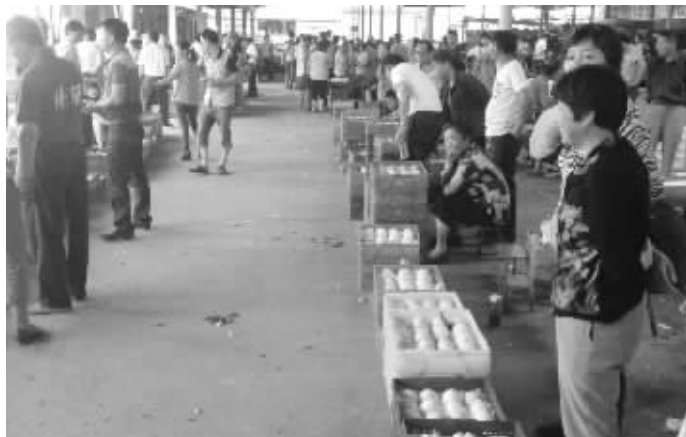
阳山水蜜桃市场内,两桃农卖假桃被罚