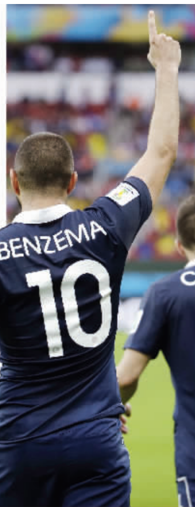
本泽马能否攻破德国大门,我们拭目以待